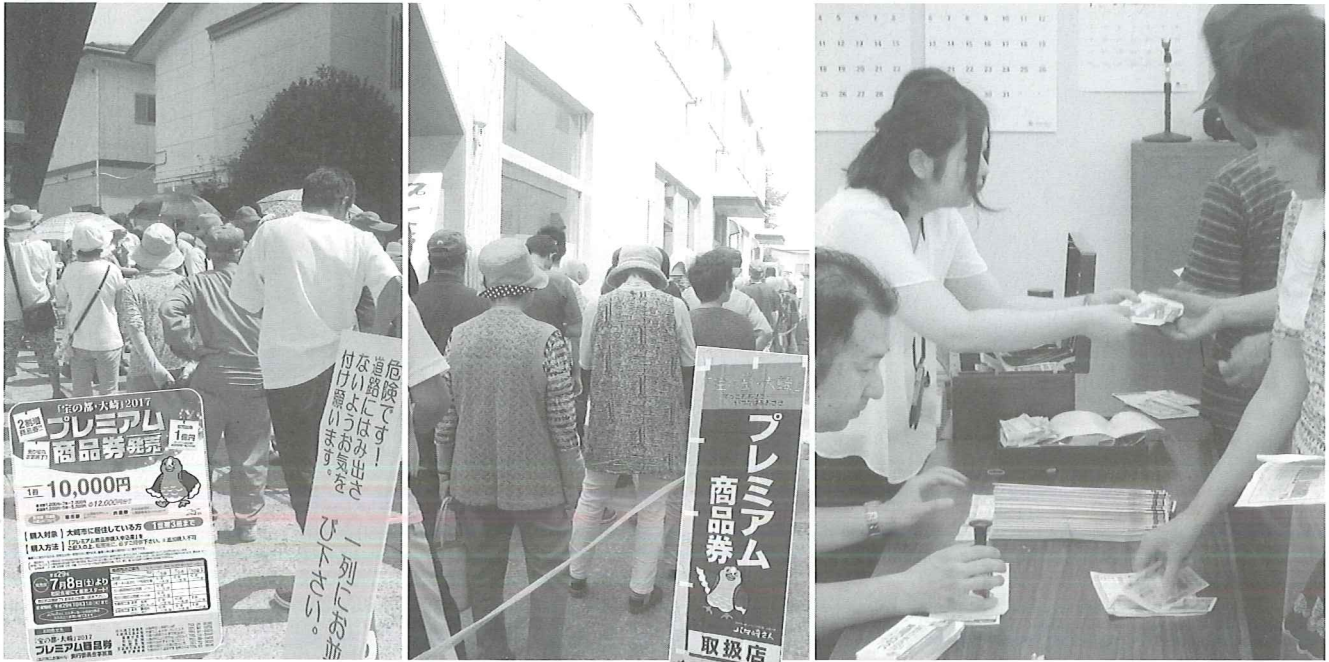
「宝の都(くに)・大崎」2017プレミアム商品券発売