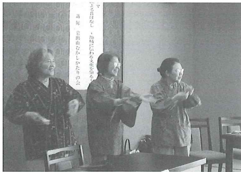
講師：岩出山昔かたりの会の方々

総会終了後、「岩出山昔かたりの会」の方々を講師に迎え「方言による昔ばなし」地域に伝わる文化を知る」をテーマに研修会を開催いたしました。活動に至るきっかけや、方言での昔話、最後には手遊び歌も教えていただきました。