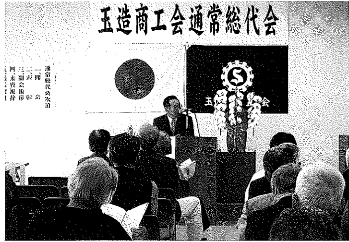
第10回を迎えた総代会